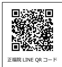
正福院 LINE QRコード